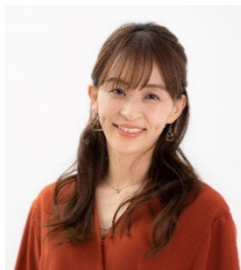
たなか りえ 田中 理恵さん (元体操選手・オリンピック)