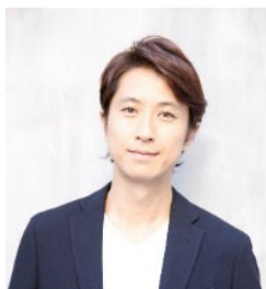
たにはら しょうすけ 谷原 章介 さん (俳優) みなとみらい7km ラン参加